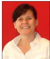
von Lisa Schierscher

Balsamico ist fantastisch um Salate und andere Speisen zu verfeinern, achten Sie bei Kauf aber unbedingt auf eine gute Qualität. Gourmet Schnell offeriert eine gute Auswahl für Ihre Bedürfnisse, lassen Sie sich beraten.